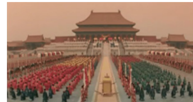
Коронация императора Пу И. Будущему монарху всего три года

Фильм повествует о печальной судьбе китайского императора Пу И, лишившегося трона и отошедшего от государственных дел. Внезапно ему выпадает шанс возродить свою империю – правительство Японии предлагает ему стать правителем небольшого государства Маньчжоу-Го (Маньчжурии).