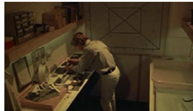
Главный герой приступает к фотоувеличению

Фильм начинает развиваться как детектив, хотя, вообще говоря, он таковым не является. Одна из главных тем фильма – непознаваемость окружающего мира – блистательно отражена в финальной сцене. Персонажи выходят на теннисный корт и начинают играть в теннис без мячей и ракеток.