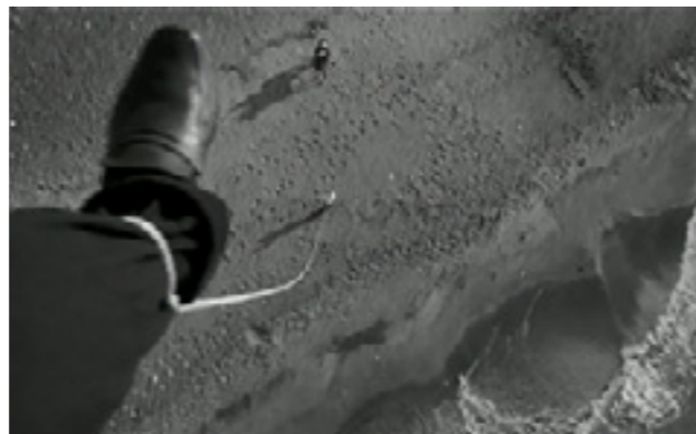
«8 1/2» - чудовищный сон главного героя

Оригинальное название фильма сразу бросается в глаза. Всё дело в том, что к этому времени Феллини поставил семь с половиной фильмов («половина» - это фильм «Огни варьете», который Феллини поставил в 1950 году совместно с режиссёром Альберто Латтудой).