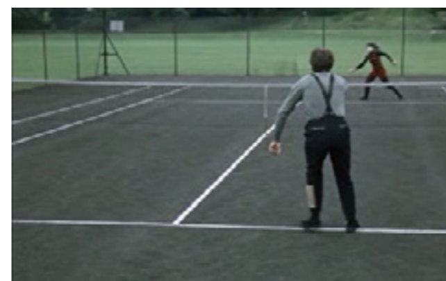
Финальная сцена фильма «Фотоувеличение» стала культовой