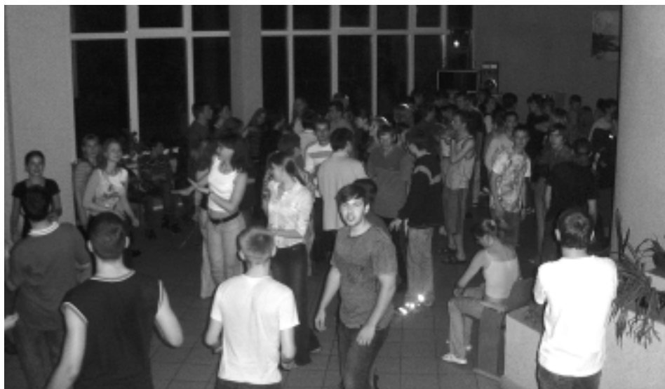
Гвоздь программы – диско! Колбасятся все!!

Сами студенты первого курса тоже решили выступить и показать всем присутствующим сценку. Необходимо было снять фильм с режиссером (старший курс) и участниками (первый курс). И картина удалась на сла-