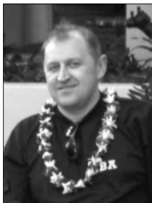
Чтобы студенты ФПМИ всегда были на Ты со знаниями и умениями в своей специальности, на Вы – с преподавателями (даже с теми, которые им не нравятся), а ВСЕ вместе ФПМовцы были единым Мы.