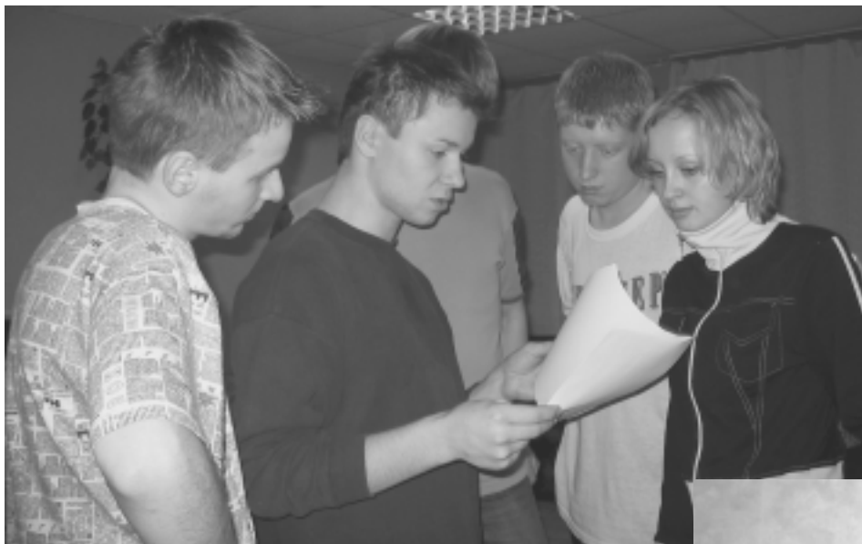
Команда за работой. Именно так создаются шедевры нашего КВНа.

знает, это и есть наши замечательные КВН-щики. Первый раз в этой роли парни попробовали себя почти 2 года назад на день рождения ФПМИ в актовом зале главного