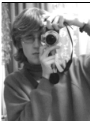
Ну, урэшце настаў час і маёй часткі віншаванняў. Жадаю... у першую чаргу пра жыць студэнцкі час так, каб потым было шкада, што яго ня вернеш. ...А больш нічога і ня трэба жадаць, здаецца. Са сьвятам!

Если вы на лекциях ведете конспект не только по предмету, но еще и по высказываниям преподавателя, то мы были бы рады, если бы вы их принесли нам. А мы непременно выставим их на общее обозрение в нашей газете.