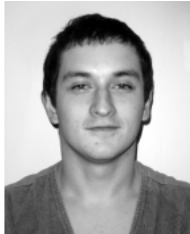
Skyr: «Меня тоже «отрубили» от сети».

– А не боишься сразу таких обязанностей?