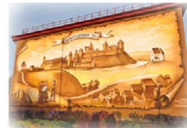
Репродукция карты Новогрудка XVI в. на здании торгового центра

Еще в нашем городе есть довольно известная швейная фабрика «Белкредо». Но увы, женской одежды она не шьет, а