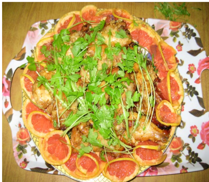
Куриные крылышки выглядят аппетитно, не правда ли?

Гвоздем этого кушанья является маринад. Готовится он так: вино смешивается с медом, черным и красным перцем, измельченным корнем имбиря, чесноком, по вкусу добавляется соль и чудо-приправа, происхождение которой мне так и не удалось узнать (мне сказали, что она есть только во Вьетнаме). Маринованные куриные крылышки отправляются в духовку.