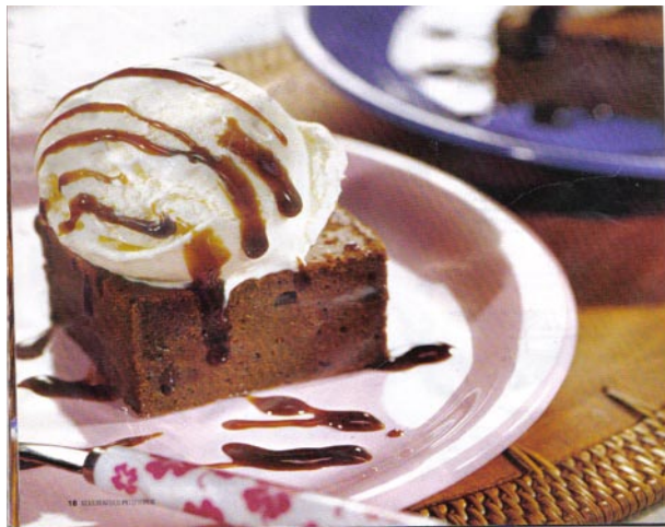
Пирог с мороженым... интересное сочетание

Необходимо почистить и порезать лук, отварить яйца, натереть морковь на крупной терке, обжарить ее и лук до золотистого цвета. Затем нарезать шампиньоны и поджарить их на слабом огне примерно 5 минут. После нарезать яйца мелкими кусочками, натереть сыр на крупной терке, добавить яйца и сыр к моркови, луку и шампиньонам. Наконец, нафаршировать тушки кальмара нашей смесью, края кальмара соединить зубочисткой, чтобы фарш не вы-