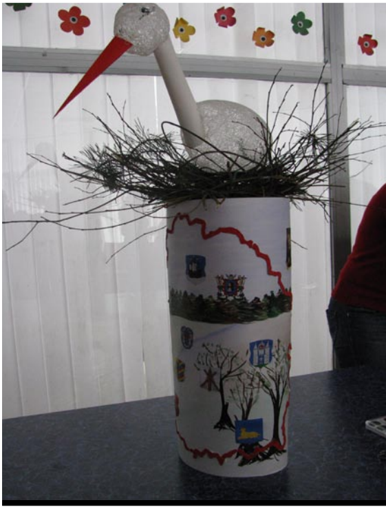
А вот наша победная композиция художественного марафона